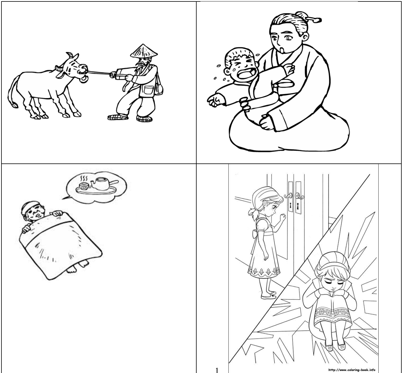
그림 속 친구가 도움이 필요해요! 누구에게 이야기해야 할까요?